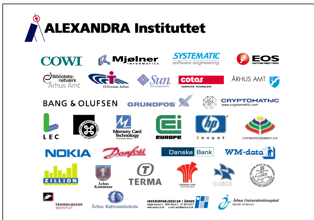
Alexandra medlemmer per 27. marts 2001

Efter en række møder i vinteren/foråret 1999 blev IT-foreningen Alexandra stiftet den 9. juni 1999, og den 27. august 1999 stiftedes Alexandra Instituttet A/S med IT-foreningen Alexandra som hovedaktionær.